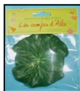
FEUILLE DE LOTUS REF : 9912PM