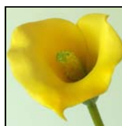
3 CALLA BA-543-