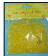
CRISTAUX REF : CRI