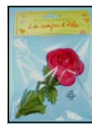
4 RENONCULES 9321XI-