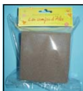
MOUSSE SECHE REF : MOUSG