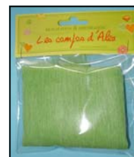
EOL PAPIER TISSU REF: EOL