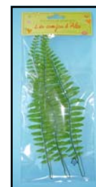
FOUGERE REF : MU-651