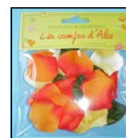
PETALES DE ROSES REF : MU-429 O

1—Découper votre pain de mousse comme sur la photo ou dans la forme que vous souhaitez. L' enrouler d'éol. Coller les feuilles de lierre puis un peu de sisal.