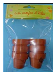
POT PLASTIQUE REF : POT