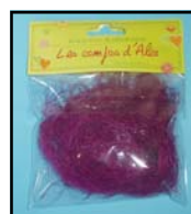
SISAL REF : SIS-A