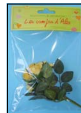
5 MINI ROSIER MIRO-J