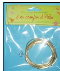
FIL DE LAITON REF : LAIT