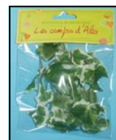
3 LIERRE REF : LIERP