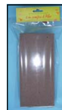
PAIN DE MOUSE GM 3700311601749 REF: MOUSGM