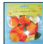
PETALES DE ROSES MU-429 O