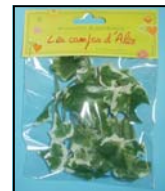
LIERRE REF : LIER