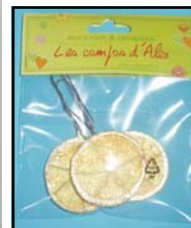
TRANCHES MANDARINE GIVREES REF : LI-235