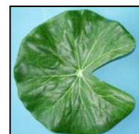
FEUILLE DE LOTUS GM REF : 9913GM

1—Travailler sur votre feuille de lotus. Coller si vous le souhaitez des feuilles de lierre comme sur la photo. 2_ Faire deux fagots de taille différente et les coller sur la feuille.