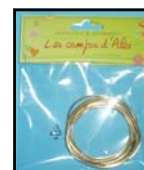
LAITON REF : LAIT