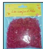
CRISTAUX REF : CRI