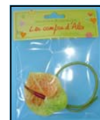
2 ANTHURIUM REF : FA-371

Prendre un soliflore de 10 à 25 cm de hauteur.