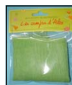
EOL PAPIER TISSU REF: EOL