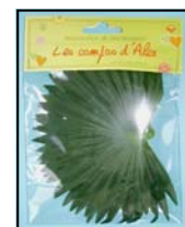
CHAMEROPS REF : SE-135