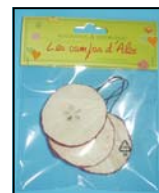
TRANCHE REF : LI-267