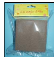
MOUSSE SECHE REF : MOUSG