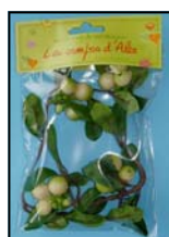
BERRY REF : MB0045-V