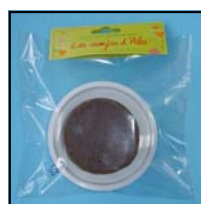
COUPELLE MOUSSE REF : COMO