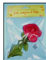
3 RENONCULE 9321X1-RB