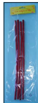
2 BAMBOU 40CM