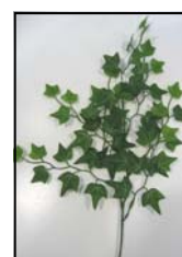
2 LIERRE F511G