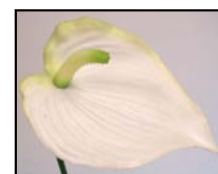
3 ANTHURIUM REF : SI-1049

1—Fixer les bambou de différentes longueurs sur une coupelle de mousse. Piquer une branche de lierre de chaque coté 2—Piquer les 2 feuilles de galax de chaque coté ,puis disposer comme sur la photo, respectivement les anthuriums,l'euphorbe (coupée en 2 ),les lys,les renoncules, puis le berry.