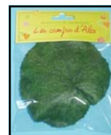
2 GALAX REF : L0077P