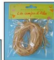
RAPHIA REF : RAF