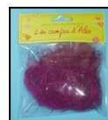
SISAL REF : SIS