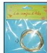
FIL DE LAITON REF : LAIT-O