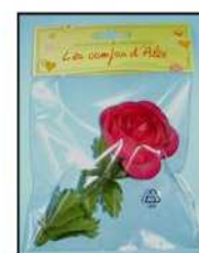
RENONCULE ROUGE BRULE 9321X1-RB