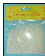
CRISTAUX REF : CRI

1_ Fabriquer une étoile avec des mikados et coller les extrémités . Coller en dessous une feuille de lotus.