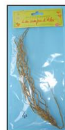
HERBE OR. HEROR