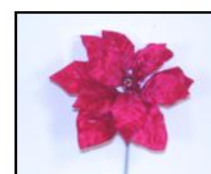
4 POINSETTIA VELOUR

3_ Pour terminer, coller les fleurs de poinsettia et orner votre composition d'herbe dorée.