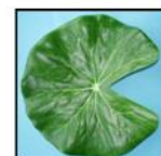
FEUILLE DE LO- TUS GM REF : 9913GM